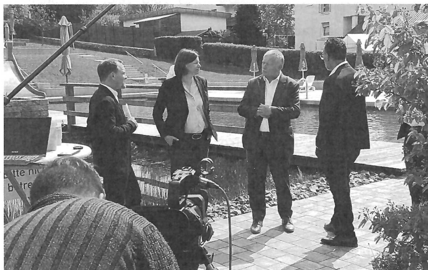
Auch in der Politik findet das Naturbad Anhänger ...

Mehrere Jahre betrug der Vorlauf, das Konzept für ein Naturbad im