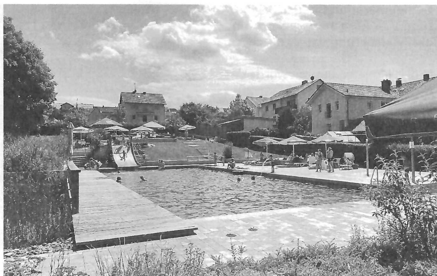
Einzigartig in der Region - das Auraer Naturbad.