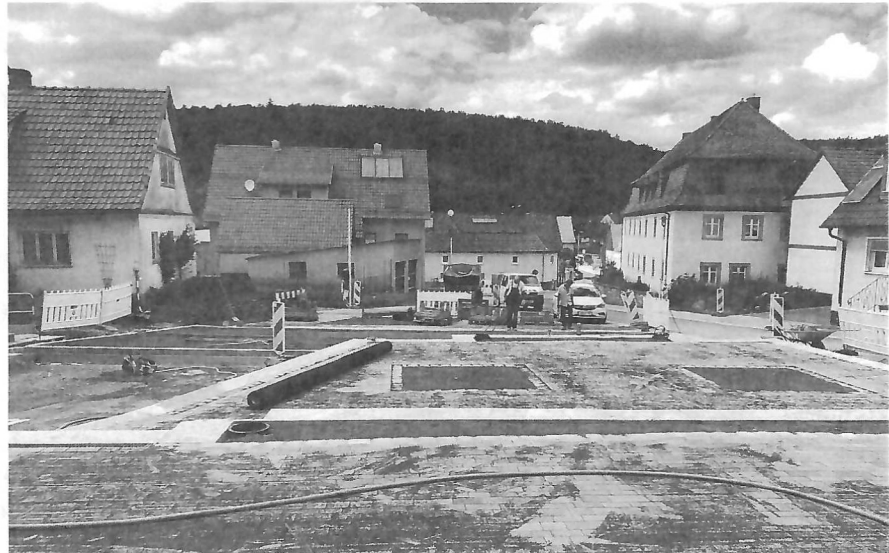
Langsam wird sichtbar, wie es final aussehen wird - der neue Bereich rund um die „Zehnt“.

Für die Städte und Gemeinden ist die Grundsteuer eine der wichtigsten Einnahmequellen. Sie fließt in die Finanzierung der Infrastruktur, zum Beispiel in den Bau von Straßen und dient der Finanzie-