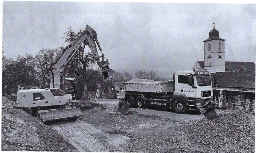
Mit schwerem Gerät nahm das Projekt schnell Formen an ...

Die Festhalle - Baujahr 1981 - ist in weiten Teilen sanierungsbedürftig. Vor allem auch die ener-